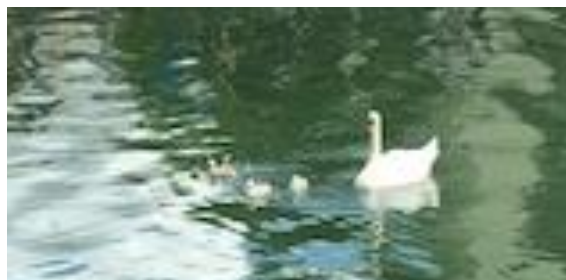
Trois nouveaux petits voisins de notre paroisse.