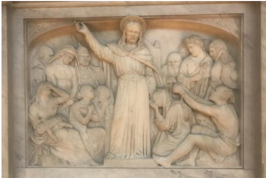
Église Saint-Jacques Saint-Christophe de la Villette, détail de la chaire – Christ enseignant des nations.

Dans la Bible, l'image du berger, du pasteur, est très présente. Elle se réfère à Moïse conduisant le peuple vers la Terre promise à travers le désert, et, plus loin dans la mémoire, aux pasteurs nomades qui furent les ancêtres d'Israël. Mais au premier plan, il y a David, le berger que Dieu a pris « derrière les brebis pour en faire le pasteur de son peuple ». Jésus